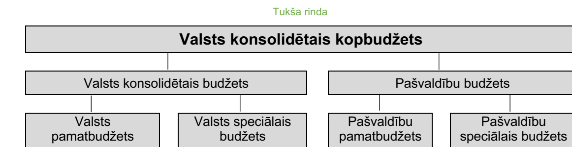
7.1. attēls. Valsts kopbudžeta struktūra 10